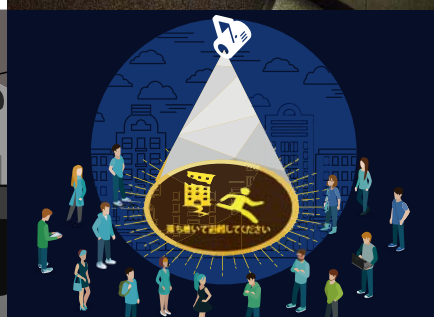
距離別投影サイズ